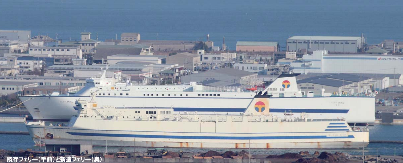
既存フェリー(手前)と新造フェリー(奥)